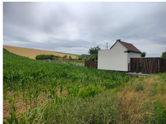
Mettet – 14/07/23 – Photo CP Maïs

La même photographie (à droite ci-dessus) a été prise lors d'un passage en date du 14/07/23 . Bien sûr, le caractère des précipitations est fort variable et n'est pas comparable d'une année à l'autre. Cependant, outre l'accumulation de sédiments sur la photographie de gauche, on notera la différence de couleur du maïs. Cette différence atteste que moins d'eau stagne en bas de la parcelle en 2023. Cette eau a donc probablement été mieux retenue sur l'ensemble de la parcelle grâce aux réservoirs créés par les diguettes. Cette comparaison n'est toutefois présentée qu'à titre indicatif.