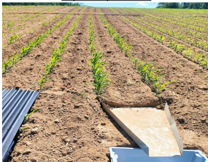
Ottignies – 09 juin 2023