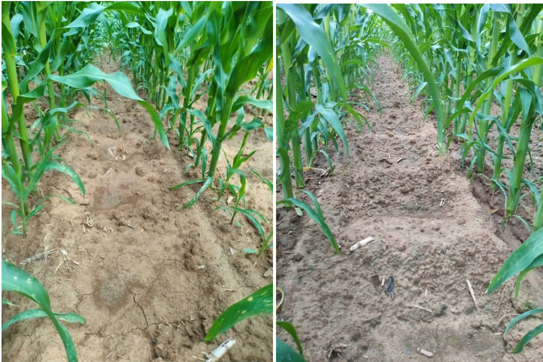
Ottignies - le 12-07-23

Il est important de préciser que les réservoirs ne sont pas saturés dans l'ensemble de l'essai. Les saturations concernent principalement la répétition 1 du système « Eruistop » et la répétition 1 du système « Estancador » (où plusieurs diguettes ont également cédé comme illustré plus haut).