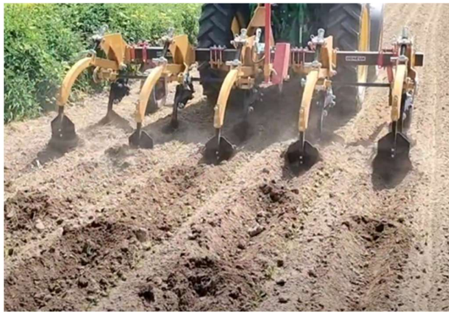
Ottignies – 02/06/23

Contrairement au système « Eruistop », les diguettes créées par le système « Estancador » ne couvrent pas la totalité de la largeur de l'inter-rang de maïs. Les réservoirs sont en réalité moins larges mais plus profonds.