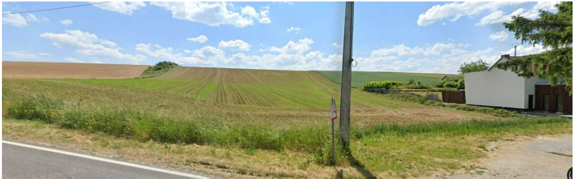
Mettet – Juin 2023 – Extrait google map

A Mettet, le Centre Pilote maïs a effectué des observations complémentaires visant à évaluer l'efficacité de l'outil « Estancador ». Il s'agit d'une parcelle de plusieurs hectares et de déclivité forte. Cette parcelle est connue pour être régulièrement sujette à des coulées boueuses tel qu'en atteste la photographie issue de google map datant d'août 2021 et présentée à gauche ci-dessous.