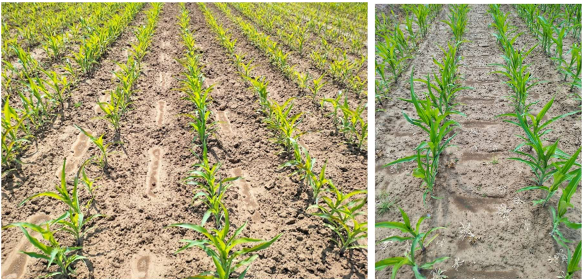
Ernage - le 21-06-23

Une partie des diguettes a été réalisée à l'aide du système « Estancador » tandis que l'autre partie a été réalisée à l'aide du système « Eruistop ». Le suivi se limite à des observations. La plus intéressante de celles-ci a eu lieu en date du 21/06/23 . A cette date, nous avons observé que les réservoirs favorisent l'infiltration de l'eau sur la parcelle. Ils permettent également de piéger les sédiments érodés au sein même de la parcelle.