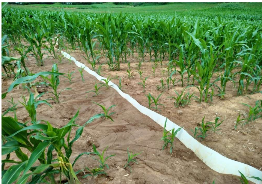
Ottignies - le 12-07-23