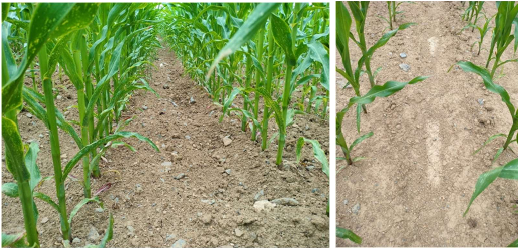
Mettet – 14/07/23

Quoique peu visibles sur les photographies suivantes prises sur le site en date du 14/07/23 , les diguettes sont très marquées. On constate cependant que les diguettes (et les réservoirs créés en amont de celles-ci) n'occupent qu'une portion de l'inter-rang.