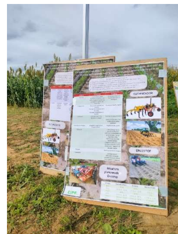
Corroy-le-Grand – 14/07/23