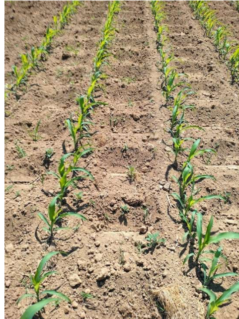
Ottignies - le 15-06-23