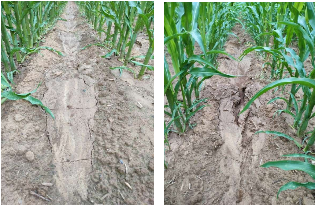
Ottignies - le 12-07-23