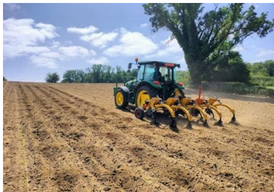
Ottignies - le 02-06-23

La photographie suivante a été prise lors de la mise en place des essais 2023. Elle illustre le principal outil évalué : l'estancador .