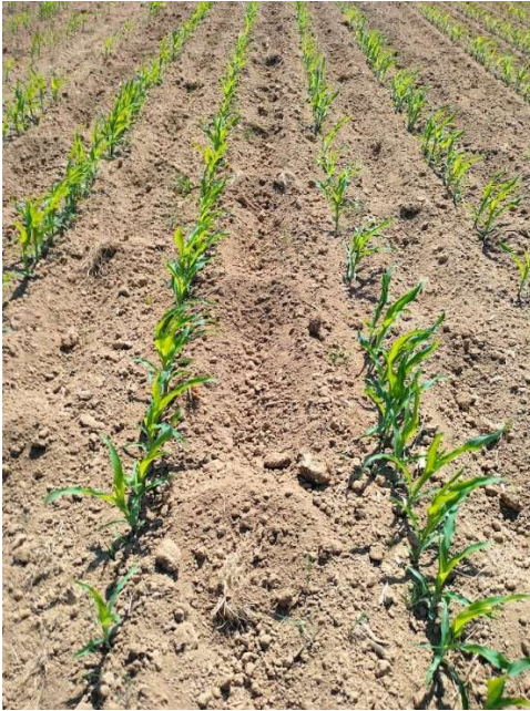
Diguettes « Estancador »